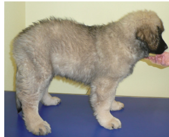
Di angelo, jeune chien avec bassin serré, dos voussé et mauvais aplombs : FTM très élevée. A gauche : Labrador avec hélice inversée qui a du mal à se coucher.

En réunissant tout cela on obtient une méthode de soin très douce, rapide et efficace sur l'homme ou tout autre mammifère.